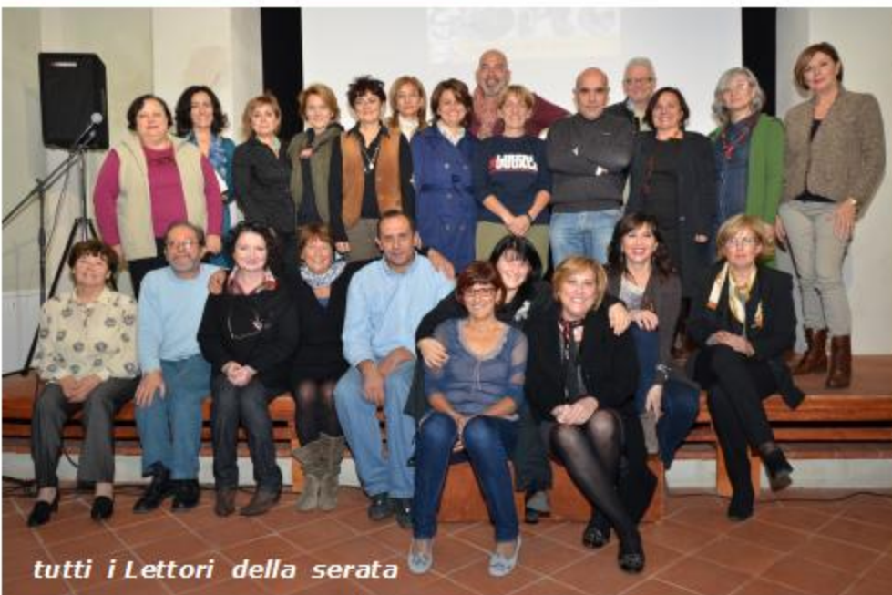
tutti i Lettori della serata