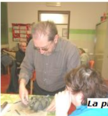
La plasticatura in sala ricreativa