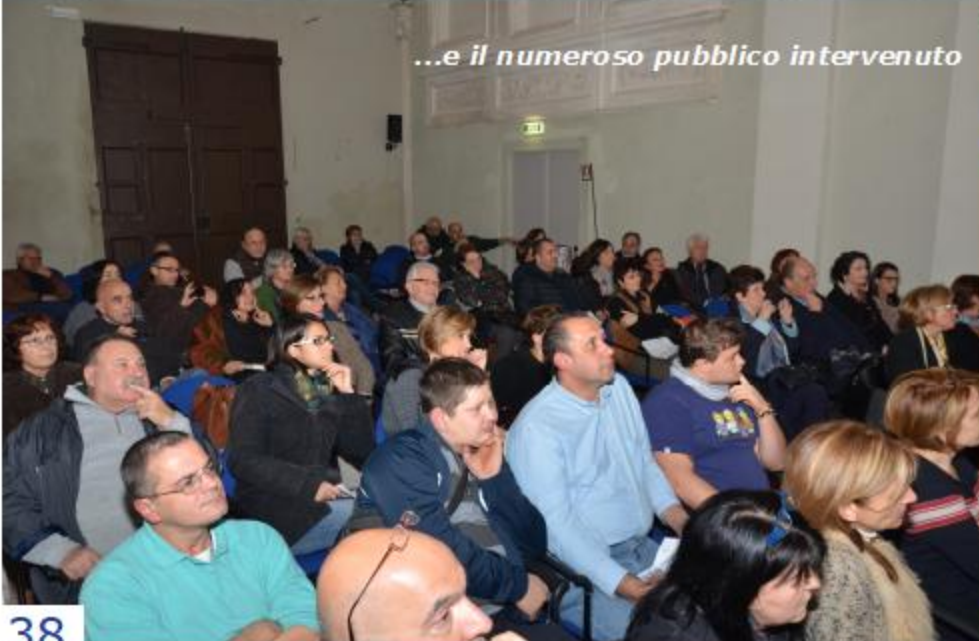
...e il numeroso pubblico intervenuto