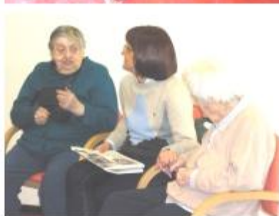
Il primo e l'ultimo diario mensile delle letture