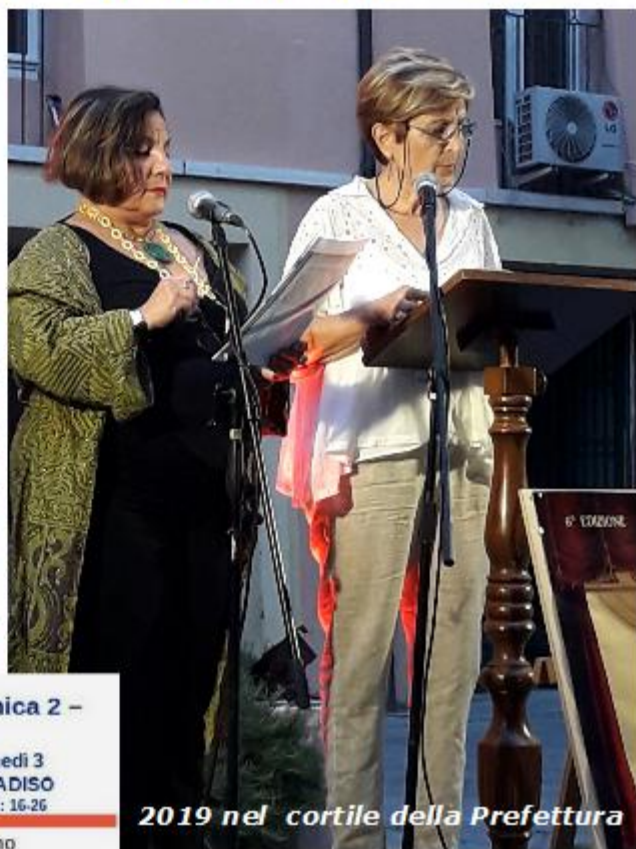
2019 nel cortile della Prefettura