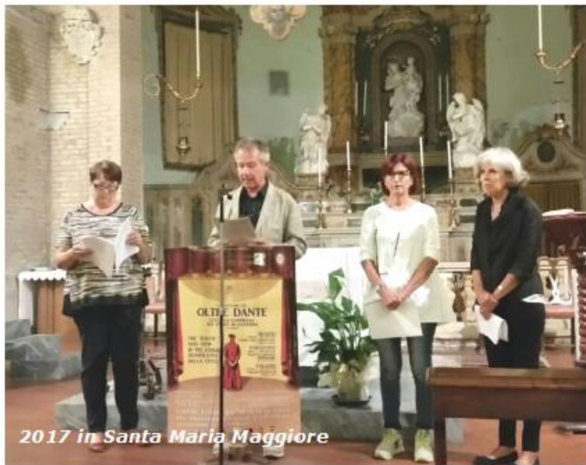
2017 in Santa Maria Maggiore